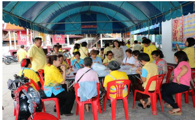
โครงการฝึกอบรมอาชีพ