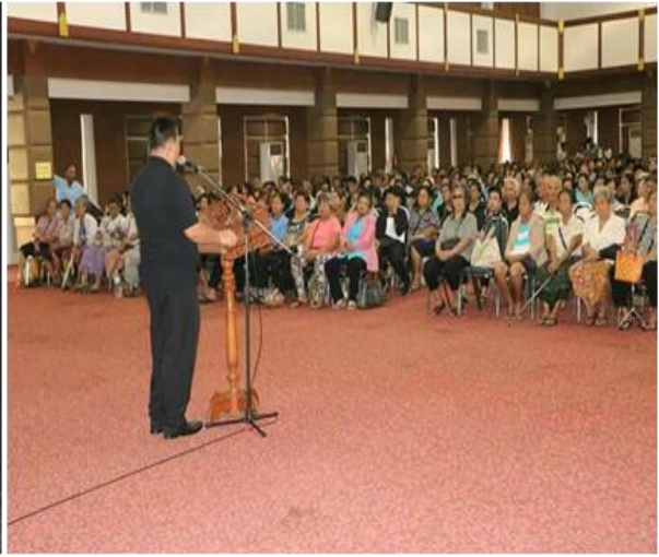
ประชาชน ห่วงใยสุขภาพดวงตา