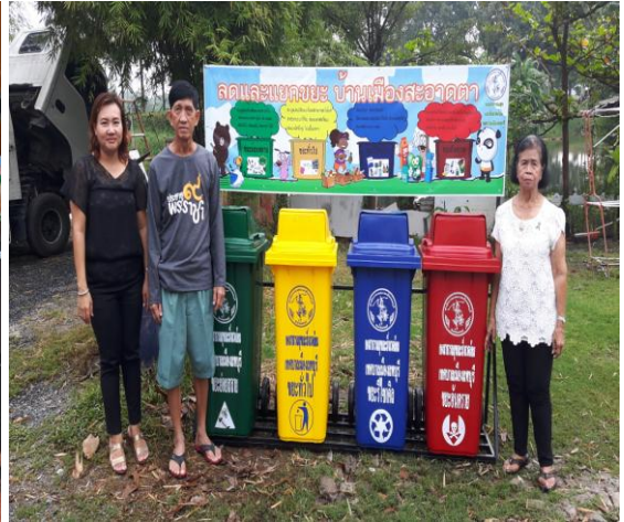
การรับซื้อขยะรีไซเคิล (Recycle) ชุมชน